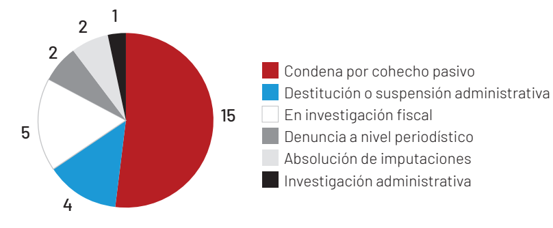
Gráfico N° 3: Estado/Resultado de los casos analizados

Sobre el estado de los casos analizados se evidencia la imposición de 19 sanciones a funcionarios involucrados en actos de extorsión sexual relacionados con actos de corrupción, de ellos solo 4 casos terminaron en la destitución o suspensión del cargo en sede administrativa y 15 en una condena penal por el delito de cohecho pasivo; además se registran 5 casos en proceso de investigación en el Ministerio Público o 1 en la Inspectoría de la Policía Nacional; se desconoce el estado final o actual de 1 caso y, por último, en 2 de los casos el funcionario acusado fue absuelto del proceso penal en su contra por cohecho pasivo [Ver Gráfico N° 3].